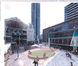
オレンジ鞆掛け箇所が、ステージエリアです。